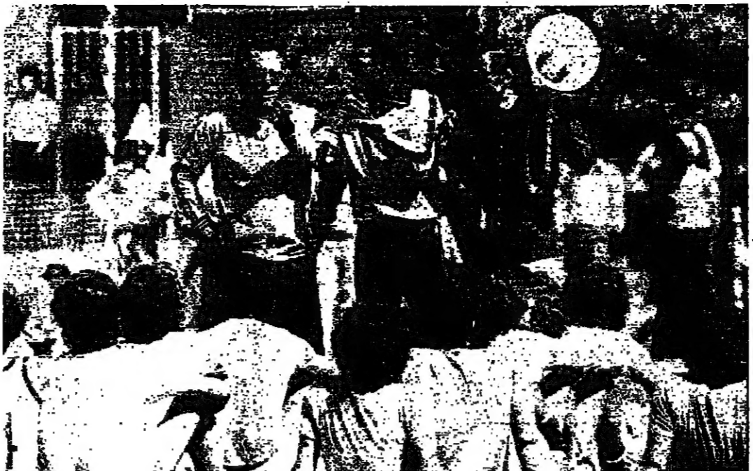
يصدر التعليمات بعد التشاور مع المدرب والمترجم وينقلها الى العربية